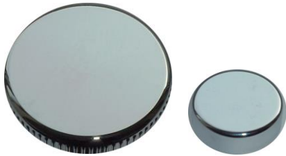
Behälter + Luftregler

Diese ist gekennzeichnet auf der Innenseite des Deckels (AROMA). Funktioniert nur bei eingeschalteten Seitendüsen. (Drehen des zusätzlichen Luftreglers) Der Aroma – Duft kann entweder mit flüssigen Duftliquiden (Innenbehälter öffnen und füllen, jedoch nicht mehr verschließen – Hauptdeckel schließen) oder nur mit Duftsäckchen (Innen-behälter entfernen, Duftsäckchen einlegen, dann Hauptdeckel wieder schließen) verwendet werden!